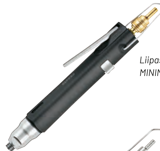
Liipaisinkäynnisteinen MINIMAT 346-331 U