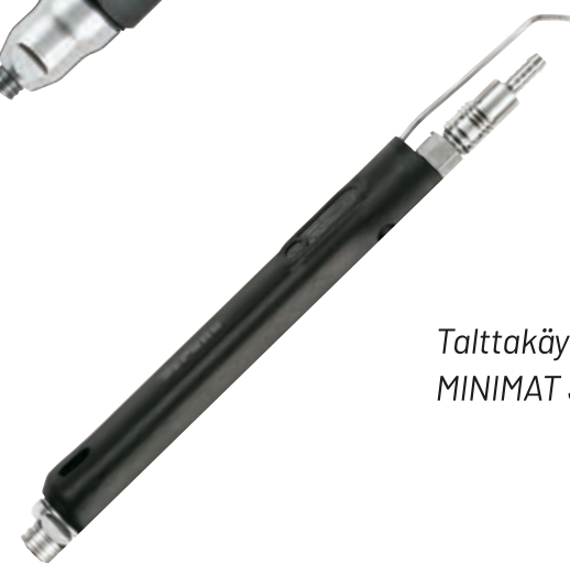
Talttakäynnisteinen MINIMAT 347-518 U