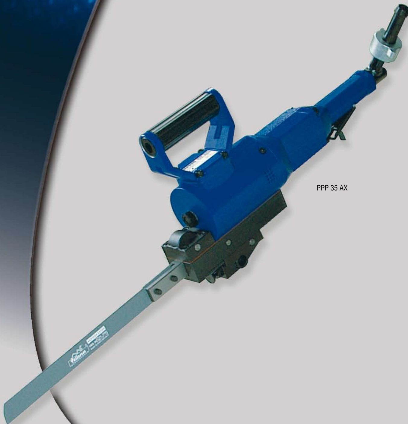
PPP 35 AX